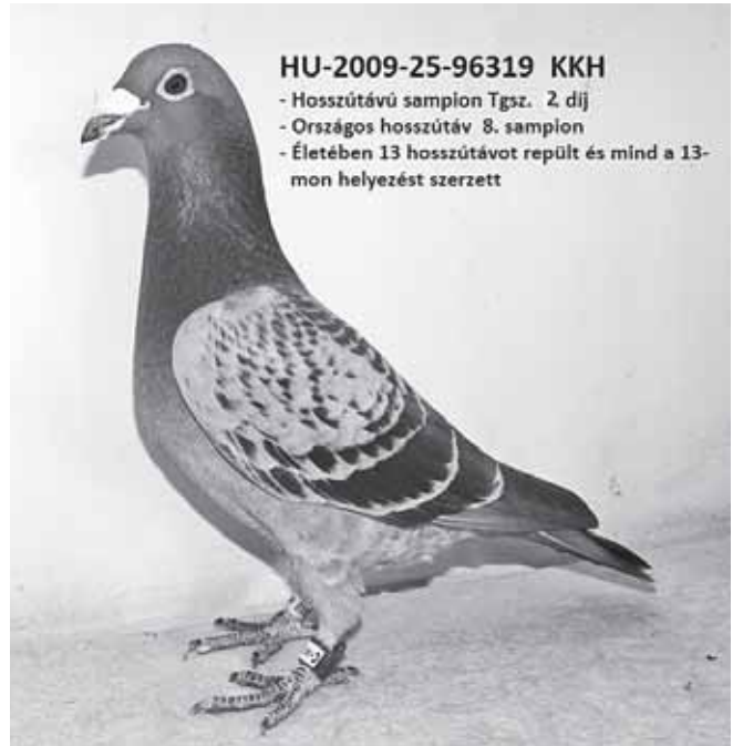
HU-2009-25-96319 KKH - Hosszútávú sampion Tgsz. 2. díj - Országos hosszútávú 8. sampion - Életében 13 hosszútávot repült és mind a 13-mon helyezést szerzett

Bár lehet, hogy sokakat kételkedéssel tölt el, de versenyzőidőszakban nem kapnak vitamint. Érkezés napján diétás eleség amennyit megessznek, de este már kimérve kapnak dzsókert, szerdáig, és innét már sport 1 borsó nélküli keveréket. Rakodás napján csak diétás van előttük – amennyit megessznek, szerdától kezdve tiszta víz. Rakodás előtt a tojókat megmutatjuk de csak elzárva, hazaérkezéskor várja a tojó szintén elzárva. Általában a tojókat 5 percig, hosszútávnál 15 percig láthatják. A tagszövetségi tréningek kezdete előtt elvisszük őket 25-30 km távolságra pár alkalommal, de később semmilyen külön tréninget nem tartunk a számukra, kizárólag csak a tagszövetségi lehetőségeket használjuk ki.