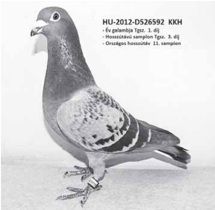
HU-2012-D526592 KKH - Év galambja Tgsz. 1. díj - Hosszútávú sampion Tgsz. 3. díj - Országos hosszútávú 11. sampion