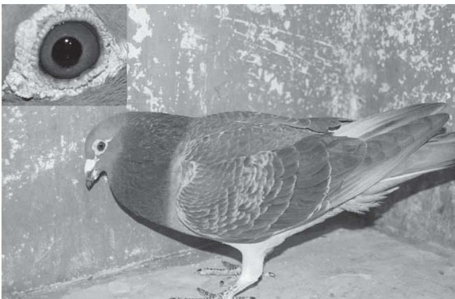
HU 12-D-470817 10 helyezéssel champion hím