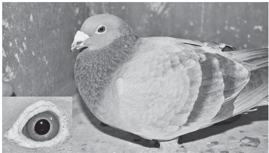
Hu 11-OL-07487 Schalie (Fulgoni X Cattrysse X Devriendt) 2014-ben Magdeburgból második díj