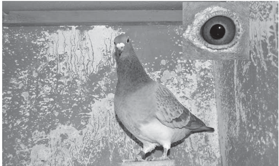
Hu 13-D-587647 Hím 2014-ben 8 helyezéssel champion hím