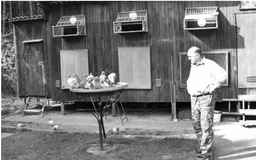
Tarácski a dúca előtt fürösztli madarait

Immár többször jártam Németországban a letelepedett Magyar galambászoknál, akik nagy szeretettel, barátsággal fogadták az Anyaországból érkező vándort.