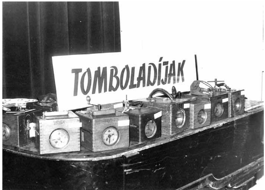
A tombolára felajánlott versenyrák egy része