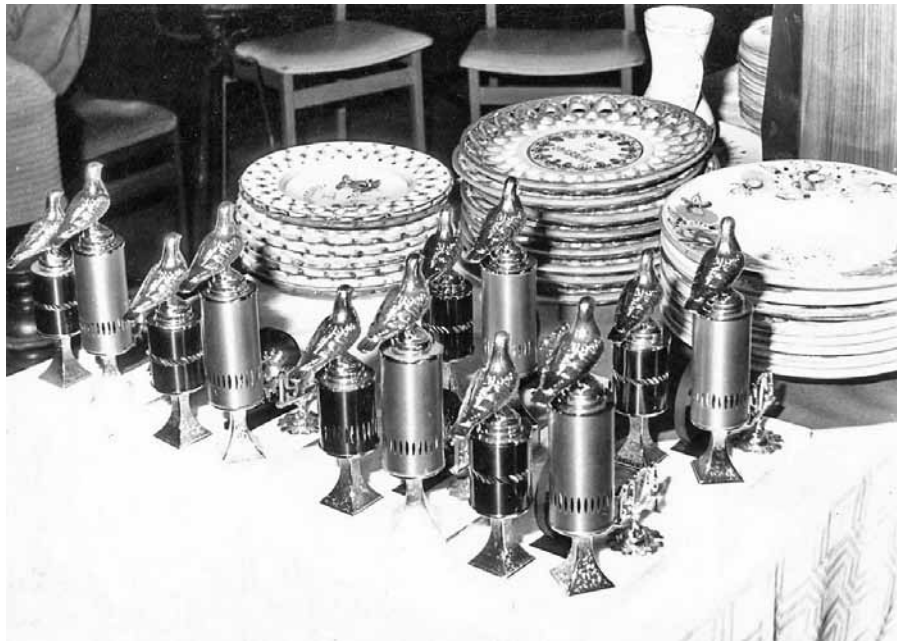
A díjak egy része

„A nyár végén ismét Magyarországra érkező Pluym további órákat ígért. Ekkor már döntés is született: a kiállítást meg kell szer-