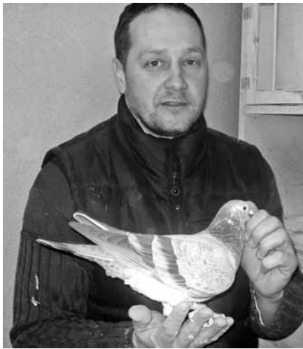
Két év - 20 helyezés