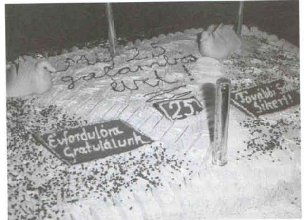
A hatalmas tortából mindenkinek jutott