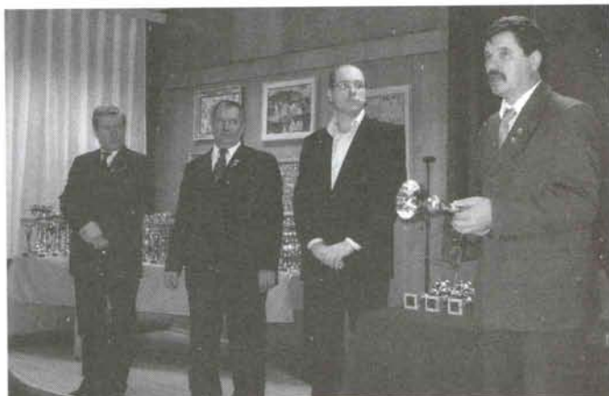
A megnyitó pillanatai

A közelmúltra visszatekintvén nem az első, élek a gyanúval nem is az utolsó díjkiosztó, melynek a díjazottjai, esetenként többen, kevesebben maradtak távol. Úgy vélem nem tisztességes többekkel szemben az eljárás. Kikre is gondolok ez esetben? Elsősorban díjnyerő