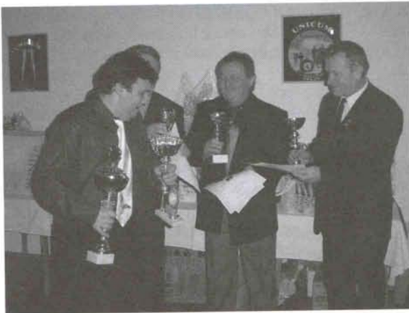
A díjkiosztó egyik pillanata