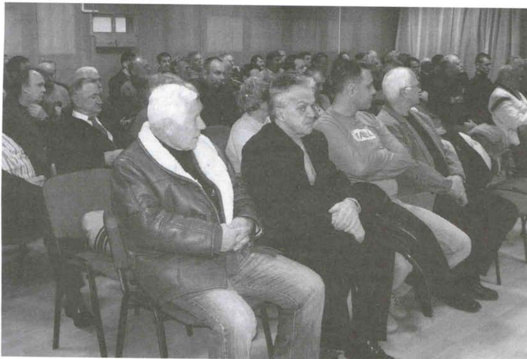
Az ünneplők egy része